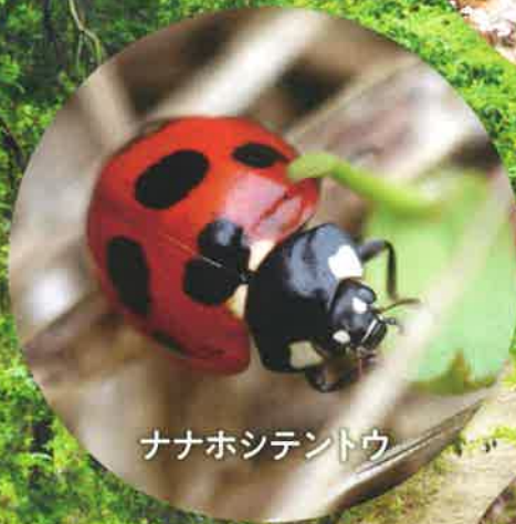
ナナホシテントウ