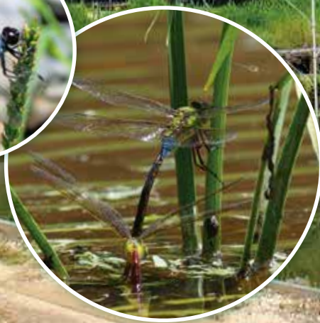
場所:トンボの湿地