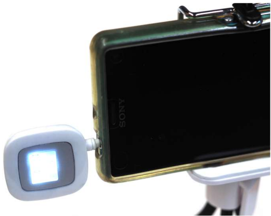
イヤホンジャックにさすLEDライト。

ただ、この位置では生き物に光が届きにくいので、マクロの撮影では少し使いにくいかも。