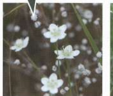
ウメバチソウとシラタマホシクサ