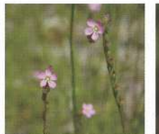
トウカイコモウセンゴケ