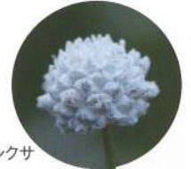
シラタマホシクサ