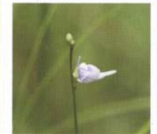
ホザキノミカキグサ