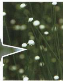
※シラタマホシクサ